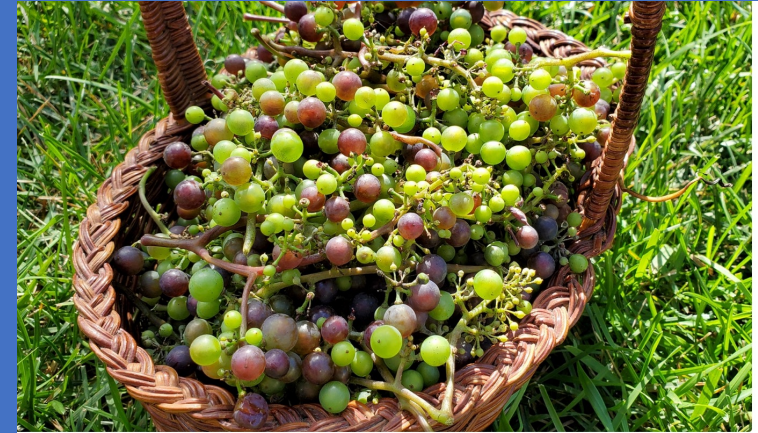
Lebanese Hosrom or Verjuice With Herbs for Cold and Flu

- Sharab el hosrom (Arabo) = bevanda da uva acerba - Ab ghooreh in Persiano -> condimento per insalate