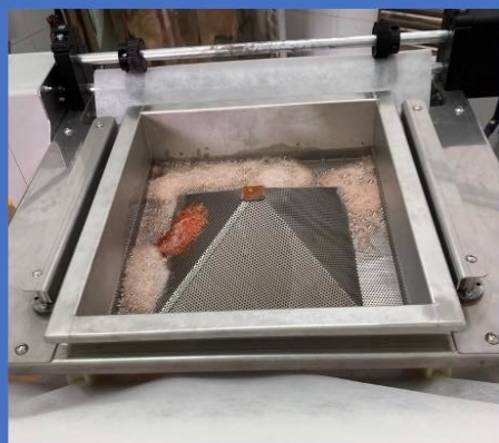
FILTRO ALTERNATIVO AL FILTRO IPPOCRATICO UTILIZZATO NEL 2022