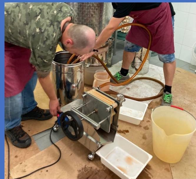
FILTRO ALTERNATIVO AL FILTRO IPPOCRATICO UTILIZZATO NEL 2021