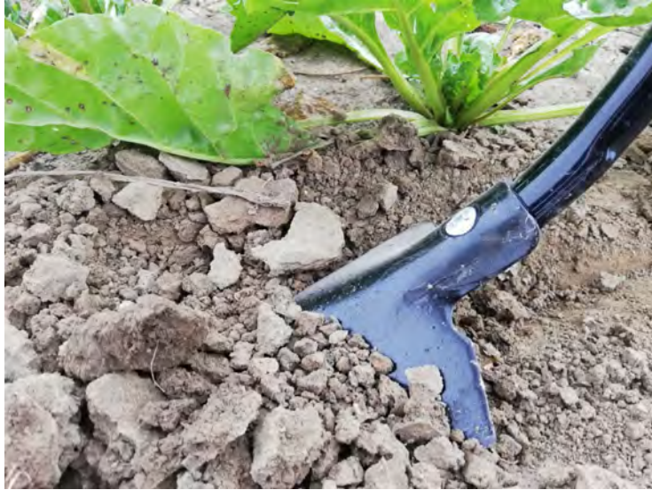
Zappa classica di elemento sarchiante flessibile