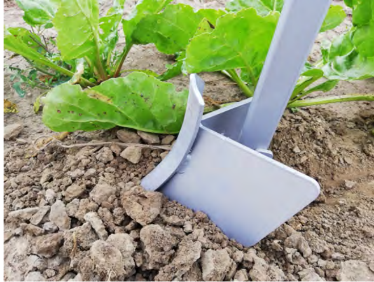
Zappa con ali per convogliamento terreno vicino alla radice