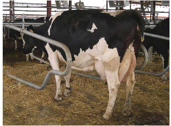
La valutazione della pulizia delle mammelle è un aspetto importante di Happy Milk.