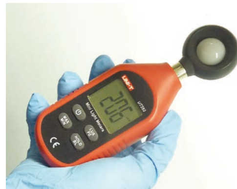
Il livello di illuminazione nelle zone di stabulazione viene misurato attraverso l'utilizzo di un luxmetro.

Complessivamente i parametri considerati sono 280: 27 per gli aspetti gestionali, 6 per le strutture d'allevamento e 247 per i sistemi di stabulazione (66 per le vacche in lattazione, 71 per le vacche in asciutta, 47 per i bovini da rimonta, 19 per i vitelli post-svezzamento, 21 per i vitelli pre-svezzamento in box collettivi e 23 per i vitelli pre-svezzamento in box singoli).