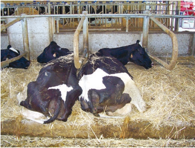
Stalla a cuccette per vacche in lattazione.